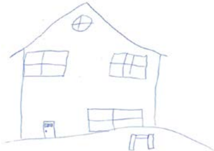
Huis van de verkoper, waar Donnie het vogeltje kocht

Toen hij bij de grot kwam, liep hij de route naar de halve bol. Hij keek om het hoekje en zag dat de robots gelukkig nog sliepen. Voorzichtig tikte hij de robot aan, die hij al kende. Het plannetje werkte goed. De robot bracht Donnie weer naar buiten en Donnie vertelde de opdracht van de koning aan de robot.