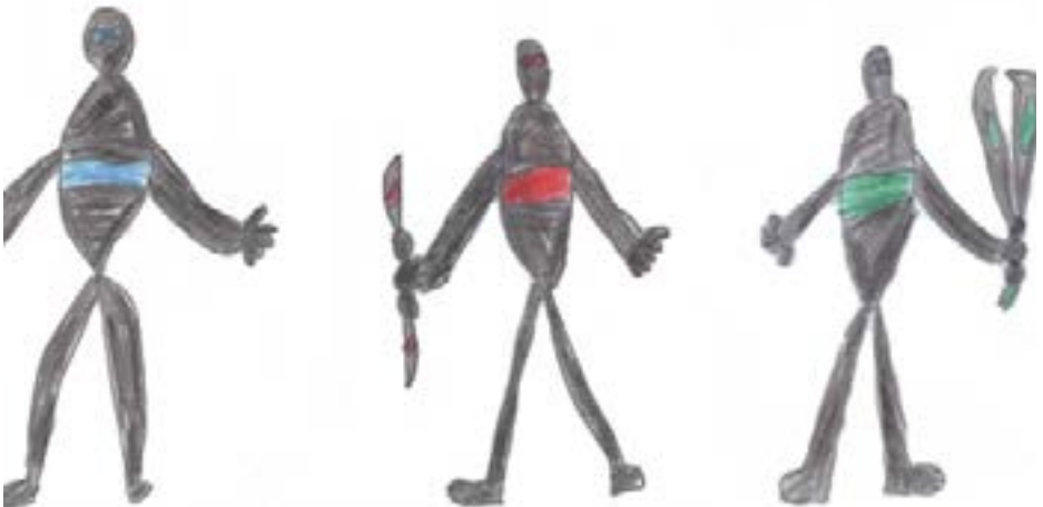
De drie dappere helden

Ondertussen wachtten de robots tot de drie helden terugkwamen. De robots hadden pistolen in hun handen, waarmee ze op de mensen schoten.